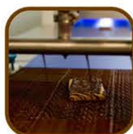
Εξάρτημα διακόσμησης (ζιγκ - ζαγκ γραμμές) (Για μοντέλο T20, T35)