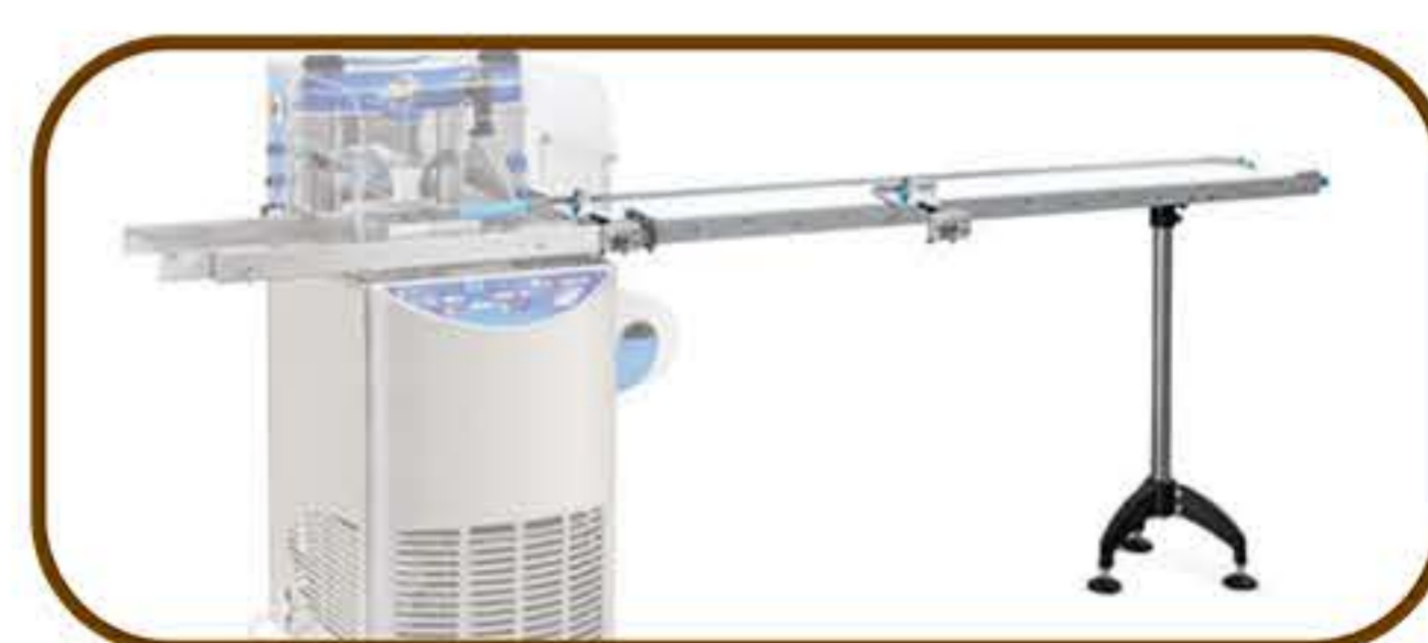
Ιμάντας εξόδου 2 μέτρα - 180/250/320 mm (Για μοντέλο T20, T35)