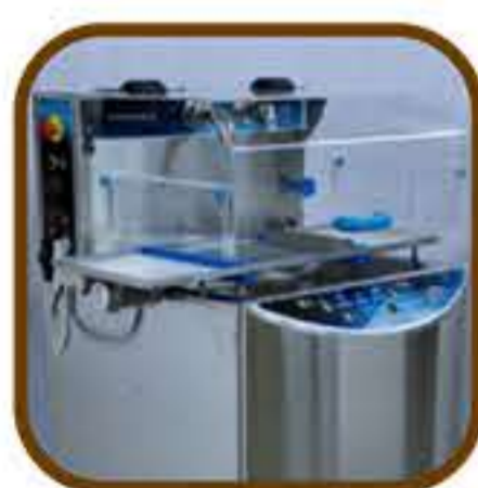
Κάλυπτρο από πλέξιγκλας (Για μοντέλο T20, T35)