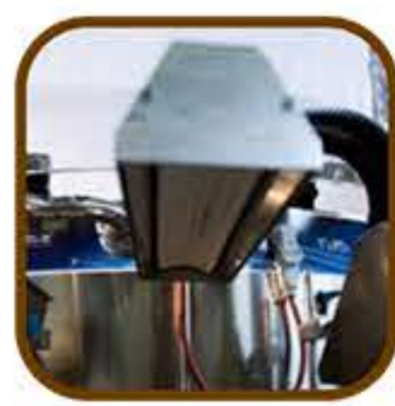
Θερμαινόμενη λάμπα (Για μοντέλο T20, T35)