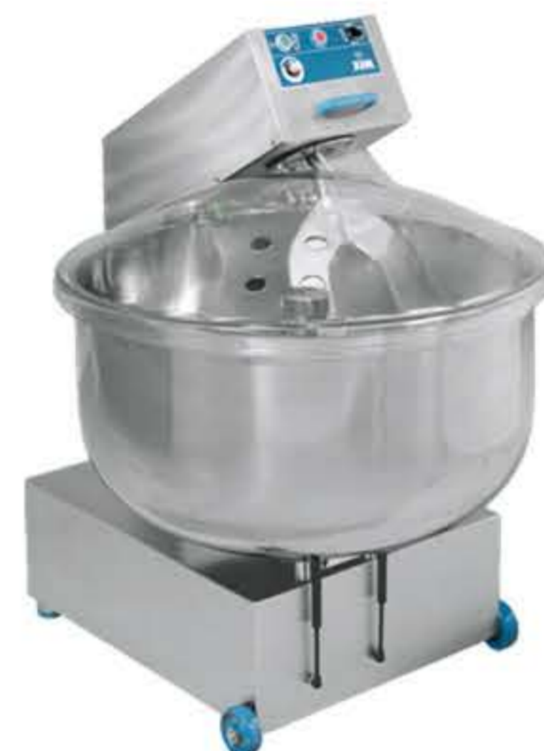
Mix 275 P