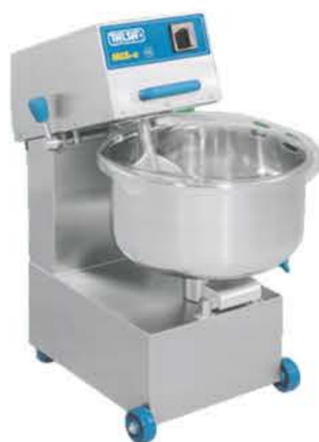
Mix 35 E