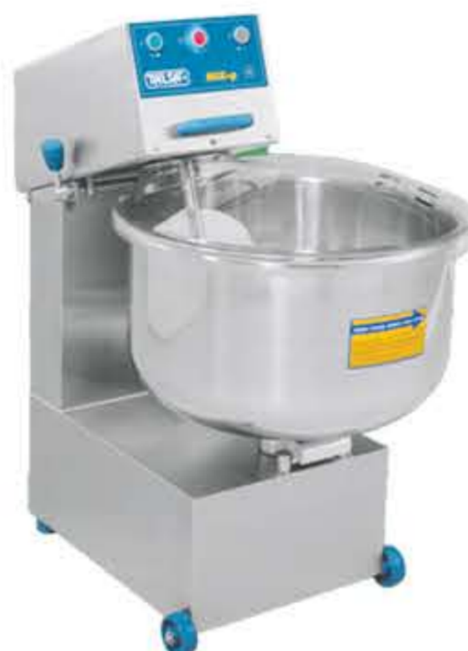
Mix 100 P