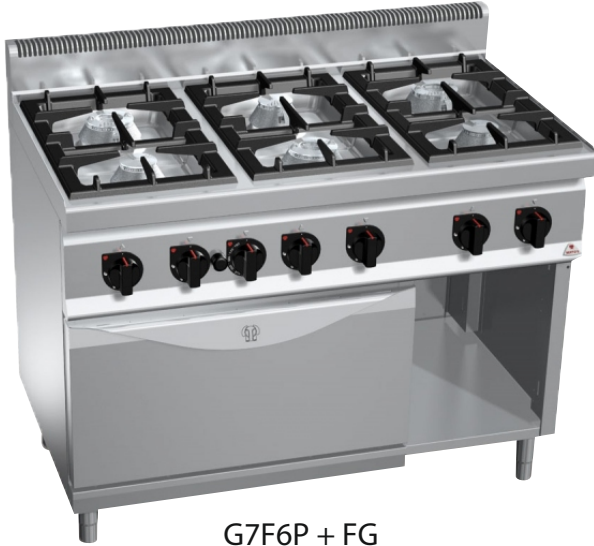
G7F6P + FG

Επιφάνεια εργασίας, μπροστινό και πλαϊνά πάνελ κατασκευασμένα από ανοξείδωτο χάλυβα AISI 304 όπως και το εσωτερικό του ερμαρίου. Εγγύηση εφ' όρου ζωής για καυστήρες χυτοσιδήρου. Κατασκευή χωρίς κολλήσεις, θερμοστάτης ασφαλείας και πιλότος προστατευόμενος από χάλκινο καπάκι για προστασία και εύκολο καθαρισμό - συντήρηση. Φούρνος αερίου εξ' ολοκλήρου κατασκευασμένος από ανοξείδωτο ατσάλι.