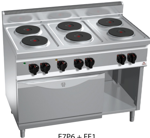
E7P6 + FE1

Επιφάνεια εργασίας, μπροστινό και πλαϊνά πάνελ κατασκευασμένα από ανοξείδωτο χάλυβα AISI 304 όπως και το εσωτερικό του ερμαρίου. Εγγύηση εφ' όρου ζωής για καυστήρες χυτοσιδήρου. Κατασκευή χωρίς κολλήσεις, θερμοστάτης ασφαλείας και πιλότος προστατευόμενος από χάλκινο καπάκι για προστασία και εύκολο καθαρισμό - συντήρηση. Φούρνος ηλεκτρικός εξ' ολοκλήρου κατασκευασμένος από ανοξείδωτο ατσάλι και γκρίλ με λειτουργία σαλαμάνδρας στην πάνω πλευρά με θερμοστάτηγια σωστή ρύθμιση της θερμοκρασίας.