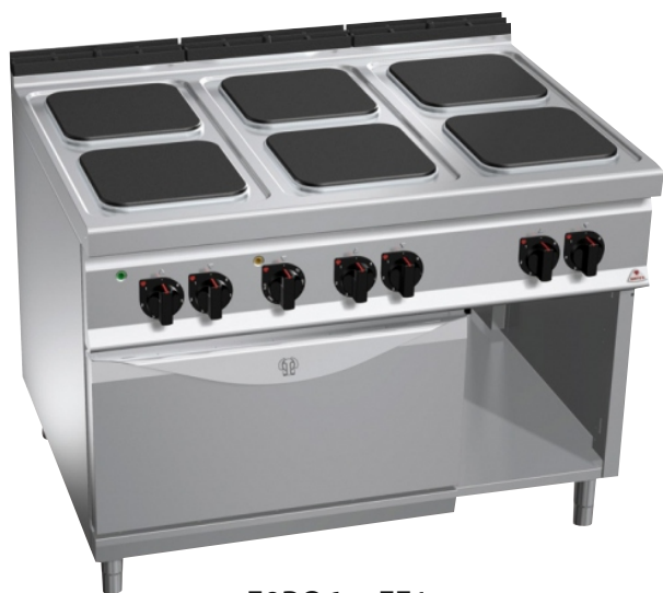
E9PQ6 + FE1

Επιφάνεια εργασίας, μπροστινό και πλαϊνά πάνελ κατασκευασμένα από ανοξείδωτο χάλυβα AISI 304 όπως και το εσωτερικό του ερμαρίου. Εγγύηση εφ' όρου ζωής για καυστήρες χυτοσιδήρου. Κατασκευή χωρίς κολλήσεις, θερμοστάτης ασφαλείας και πιλότος προστατευόμενος από χάλκινο καπάκι για προστασία και εύκολο καθαρισμό - συντήρηση. Φούρνος ηλεκτρικός εξ' ολοκλήρου κατασκευασμένος από ανοξείδωτο ατσάλι και γκρίλ με λειτουργία σαλαμάνδρας στην πάνω πλευρά με θερμοστάτη για σωστή ρύθμιση της θερμοκρασίας.