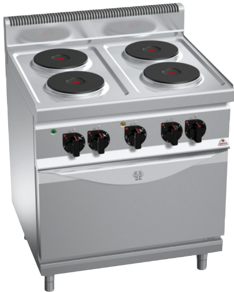
E6P4 + FE1

Επιφάνεια εργασίας, μπροστινό και πλαϊνά πάνελ κατασκευασμένα από ανοξείδωτο χάλυβα AISI 304 όπως και το εσωτερικό του ερμαρίου. Εγγύηση εφ' όρου ζωής για καυστήρες χυτοσιδήρου. Κατασκευή χωρίς κολλήσεις, θερμοστάτης ασφαλείας και πιλότος προστατευόμενος από χάλκινο καπάκι για προστασία και εύκολο καθαρισμό - συντήρηση. Φούρνος ηλεκτρικός εξ' ολοκλήρου κατασκευασμένος από ανοξείδωτο ατσάλι και γκρίλ με λειτουργία σαλαμάνδρας στην πάνω πλευρά με θερμοστάτηγια σωστή ρύθμιση της θερμοκρασίας.