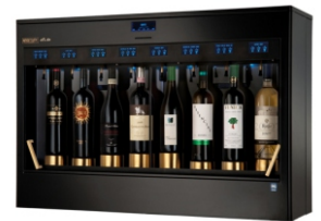
Black Elegance Precious