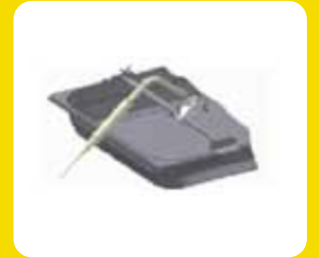
Βάση στήριξης ακίδας για ρευστά προϊόντα