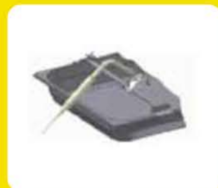
Βάση στήριξης ακίδας για ρευστά προϊόντα