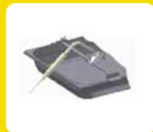
Βάση στήριξης ακίδας για ρευστά προϊόντα