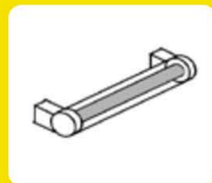
Λάμπα UV αποστείρωσης θαλάμου