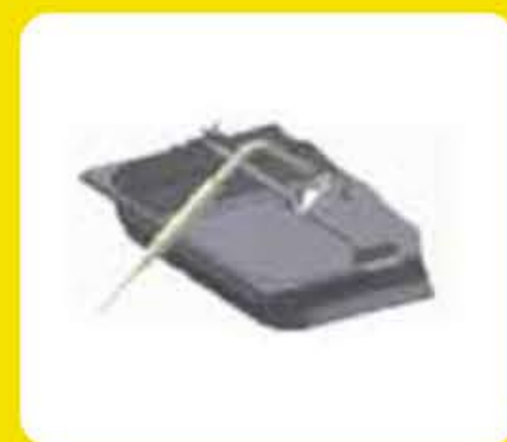
Βάση στήριξης ακίδας για ρευστά προϊόντα