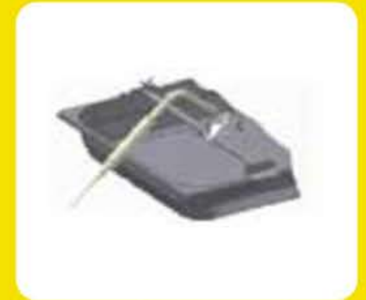
Βάση στήριξης ακίδας για ρευστά προϊόντα