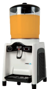
MAGIC DRINK 12-1