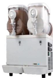
GRANISMART 2 EVOLUTION