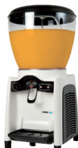
MAGIC DRINK 20-1