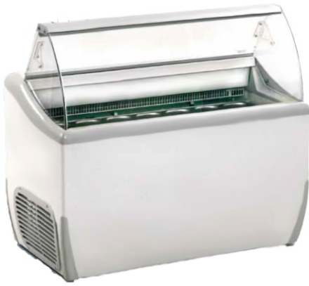
J 7 Extra

Βιτρίνα παγωτού με κουρμπαριστό τζάμι με δυνατότητα στοίβαξης διπλής σειράς δοχείων στην περιοχή προβολής ( μέγιστο ύψος 120 mm). Διαθέτει ηλεκτρονικό θερμοστάτη με αυτόματη απόψυξη, εσωτερικό φωτισμό, σύστημα εξοικονόμησης ενέργειας, τμήμα αποθήκευσης για λεκανάκια παγωτού μέσα στην βιτρίνα και 4 τροχούς για εύκολη μετακίνηση της.