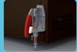
Σύστημα κλειδώματος των τροχών ο οποίος αποτελείται από 2 μηχανικά stop