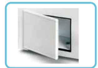
Αποθήκη με αυτόματη επαναφορά πόρτας