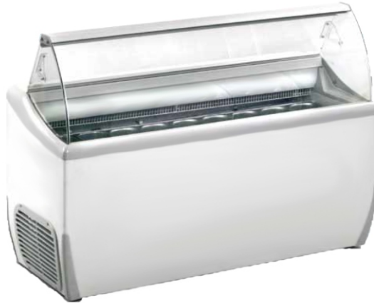
J 9 Extra