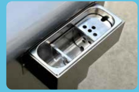
Λεκάνη πλυσίματος σπάτουλας