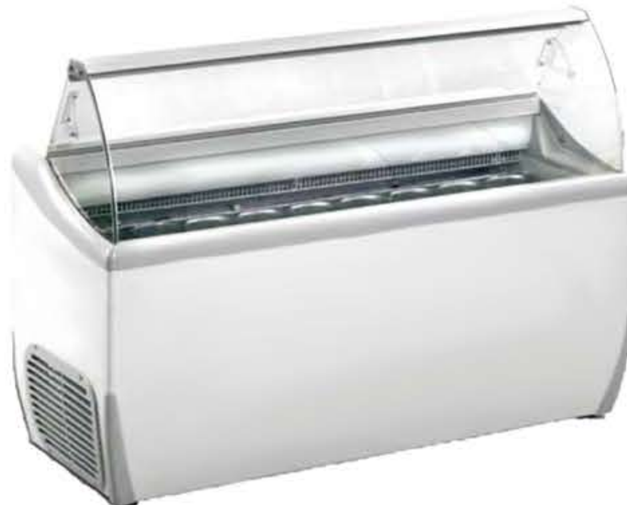
J 9 Extra