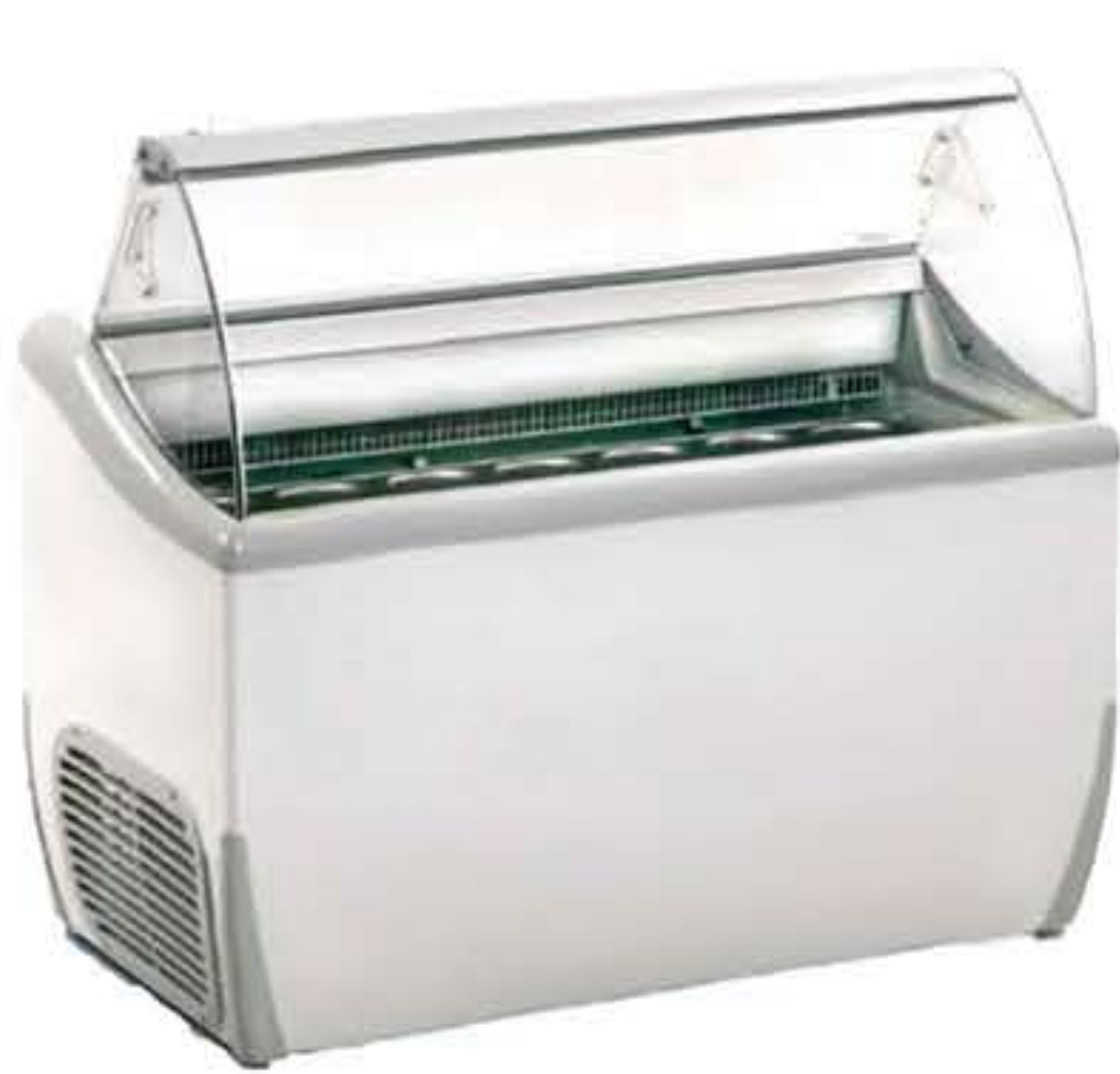
J 7 Extra

Βιτρίνα παγωτού με κουρμπανιστό τζάμι με δυνατότητα στοίβαξης διπλής σειράς δοχείων στην περιοχή προβολής ( μέγιστο ύψος 120 mm). Διαθέτει ηλεκτρονικό θερμοστάτη με αυτόματη απόψυξη, εσωτερικό φωτισμό, σύστημα εξοικονόμησης ενέργειας, τμήμα αποθήκευσης για λεκανάκια παγωτού μέσα στην βιτρίνα και 4 τροχούς για εύκολη μετακίνηση της .