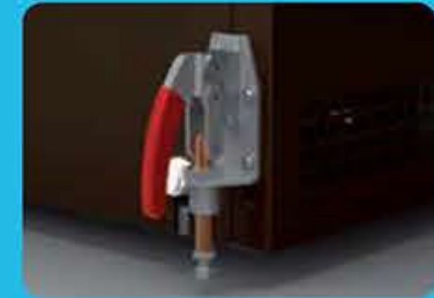
Σύστημα κλειδώματος των τροχών ο οποίος αποτελείται από 2 μηχανικά stop