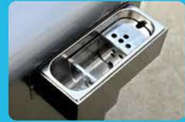
Λεκάνη πλυσίματος σπάτουλας