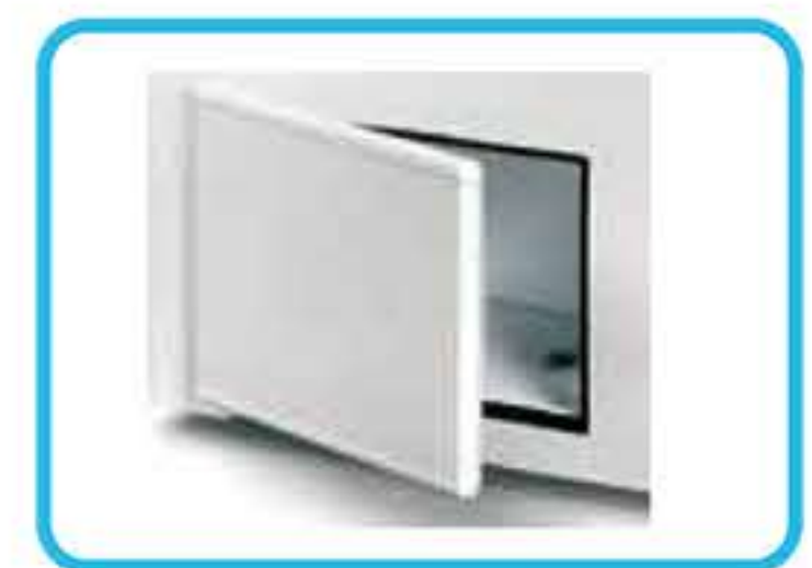
Αποθήκη με αυτόματη επαναφορά πόρτας