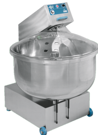
Mix 275 P