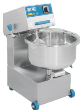
Mix 35 E