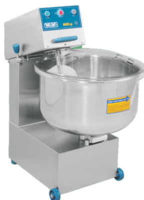
Mix 100 P