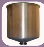
Χοάνη κάθετου τύπου 25 λίτρων