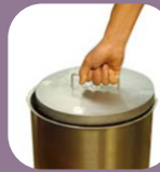
Πλάκα από ανοξείδωτο ατσάλι για έξτρα πίεση