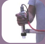
Πιστόλι - στόμιο για γέμισμα