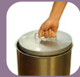
Πλάκα από ανοξείδωτο ατσάλι για έξτρα πίεση