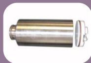
Κύλινδρος - έμβολο για διαφορετικές δοσολογίες

Πινάκια διαστάσεων και τιμών για κύλινδρο - έμβολο