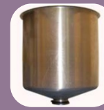
Χοάνη κάθετου τύπου 60 λίτρων