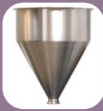
Κωνική χοάνη 25 λίτρων