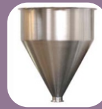
Κωνική χοάνη 60 λίτρων