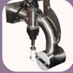
Στόμιο με περιστροφική κίνηση