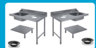
Πάσο εισόδου-εξόδου πλυντηρίου με λάντζα και οπή για απορρίματα ( Αριστερό - Δεξί)