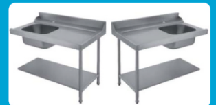
Πάσο εισόδου-εξόδου πλυντηρίου με λάντζα ( Αριστερό - Δεξί)