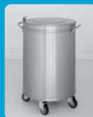
Κάδος απορριμάτων Διαστάσεις: Ø 40 cm - Ύψος 70 cm