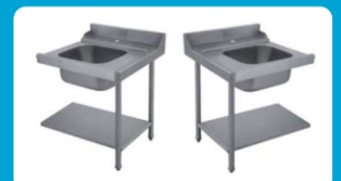
Πάσο εισόδου-εξόδου πλυντηρίου με λάντζα ( Αριστερό - Δεξί)