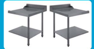
Πάσο εισόδου-εξόδου πλυντηρίου ( Αριστερό - Δεξί)