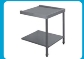
Πάσο εισόδου-εξόδου πλυντηρίου