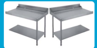
Πάσο εισόδου-εξόδου πλυντηρίου ( Αριστερό - Δεξί)