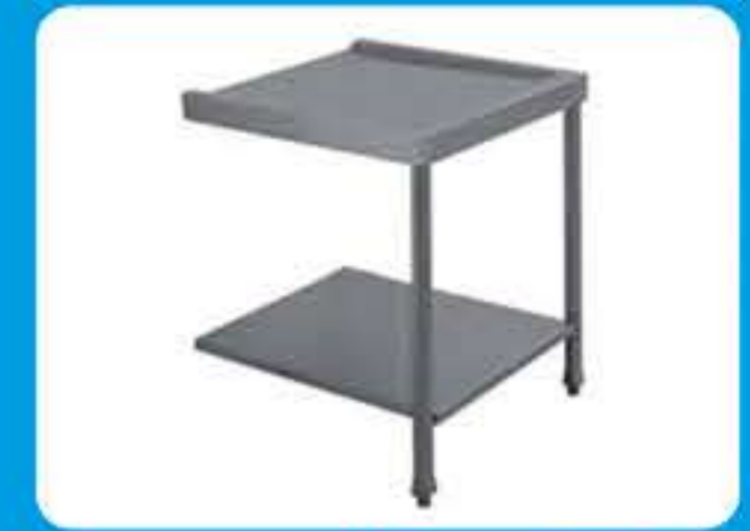
Πάσο εισόδου-εξόδου πλυντηρίου