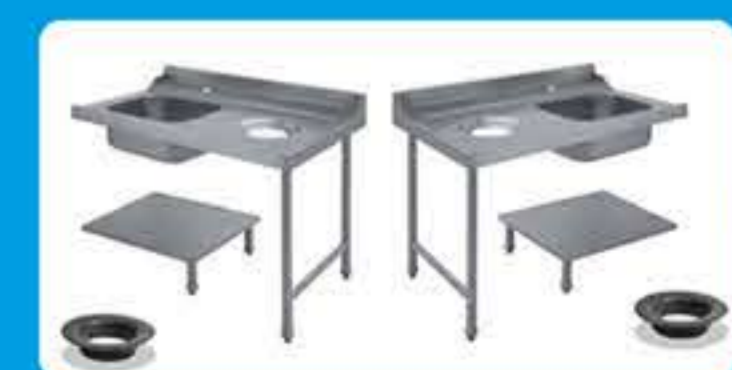
Πάσο εισόδου-εξόδου πλυντηρίου με λάντζα και οπή για απορρίματα ( Αριστερό - Δεξί)