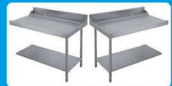
Πάσο εισόδου-εξόδου πλυντηρίου ( Αριστερό - Δεξί)