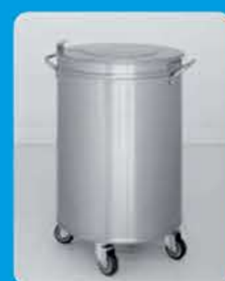
Κάδος απορριμάτων Διαστάσεις: Ø 40 cm - Ύψος 70 cm