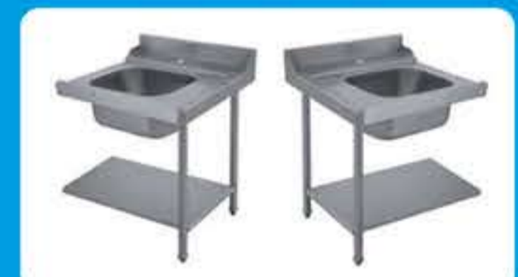
Πάσο εισόδου-εξόδου πλυντηρίου με λάντζα ( Αριστερό - Δεξί)