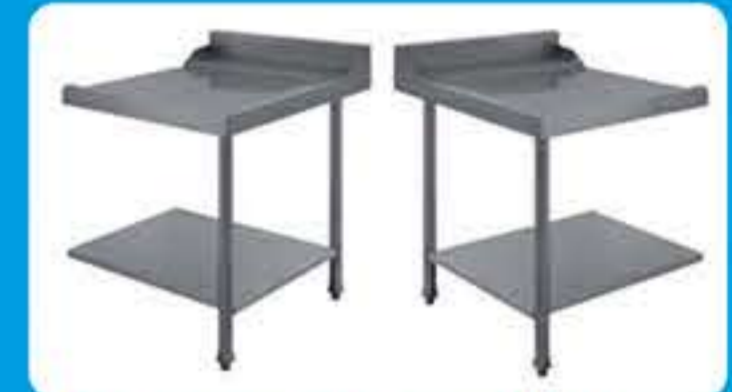
Πάσο εισόδου-εξόδου πλυντηρίου ( Αριστερό - Δεξί)