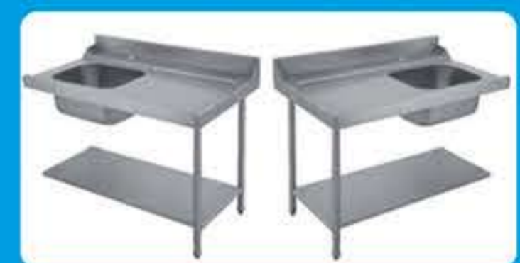
Πάσο εισόδου-εξόδου πλυντηρίου με λάντζα ( Αριστερό - Δεξί)