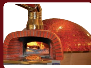
Δυνατότητα επένδυσης φούρνου με πλακάκι-ψηφίδα Type 35