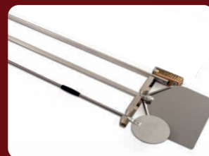
Εξαρτήματα φούρνου (Σετ με 2 φτυάρια και 1 βούρτσα)