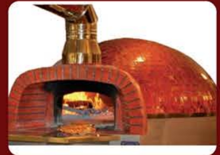
Δυνατότητα επένδυσης φούρνου με πλακάκι-ψηφίδα Type 35