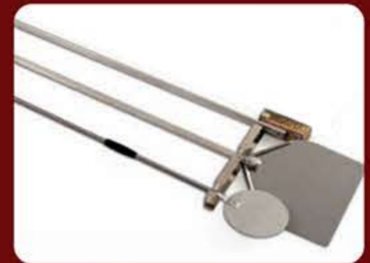
Εξαρτήματα φούρνου (Σετ με 2 φτυάρια και 1 βούρτσα)