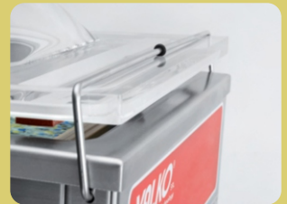
Σφιγκτήρας για το καπάκι