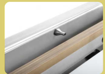
Υποδοχή για τροποποιημένη ατμόσφαιρα