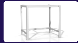
Ανοξείδωτη βάση Διαστάσεων: 88 x 56 x 91 cm