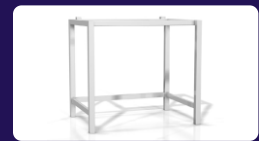
Ανοξείδωτη βάση Διαστάσεων: 95 x 71 x 94 cm