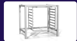
Ανοξείδωτη βάση Διαστάσεων: 95 x 71 x 94 cm Χωρητικότητα: 10 λαμαρίνες (60 x 40 cm)