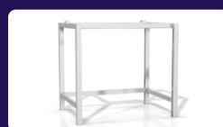
Ανοξείδωτη βάση Διαστάσεων: 95 x 71 x 78 cm