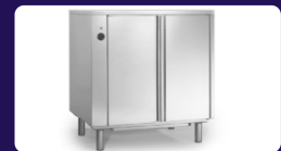
Θερμοθάλαμος Διαστάσεων: 83 x 59 x 85 cm Χωρητικότητα: 8 GN 1/1 (53 x 32,5 cm) Διάκενο: 70 mm Ισχύς: 2,6 Kw Τάση: 230 V