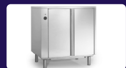
Θερμοθάλαμος Διαστάσεων: 83 x 59 x 75 cm Χωρητικότητα: 8 GN 1/1 (53 x 32,5 cm) Διάκενο: 75 mm Ισχύς: 2,6 Kw Τάση: 230 V