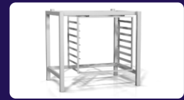
Ανοξείδωτη βάση Διαστάσεων: 83 x 59 x 75 cm Χωρητικότητα: 7 GN 1/1 (53 x 32,5 cm) Διάκενο: 70 mm