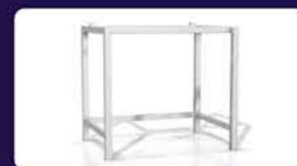
Ανοξείδωτη βάση Διαστάσεων: 83 x 59 x 85 cm