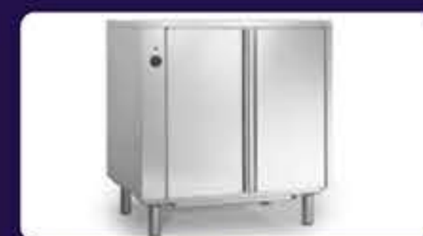
Θερμοθάλαμος Διαστάσεων: 83 x 59 x 85 cm Χωρητικότητα: 8 GN 1/1 (53 x 32,5 cm) Διάκενο: 70 mm Ισχύς: 2,6 Kw Τάση: 230 V