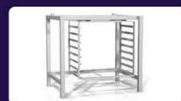
Ανοξείδωτη βάση Διαστάσεων: 83 x 59 x 85 cm Χωρητικότητα: 8 GN 1/1 (53 x 32,5 cm) Διάκενο: 70 mm