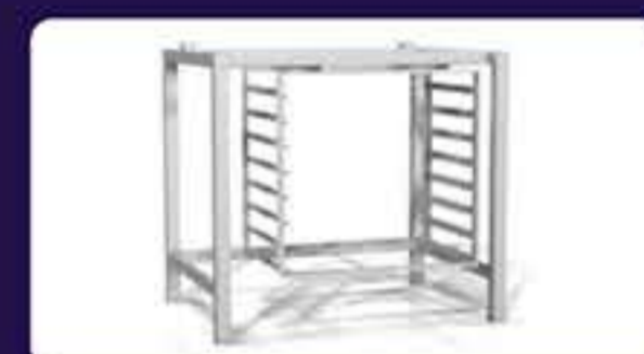
Ανοξείδωτη βάση Διαστάσεων: 90 x 66 x 85 cm Χωρητικότητα: 8 λαμαρίνες (60 x 40 cm) Διάκενο: 73 mm