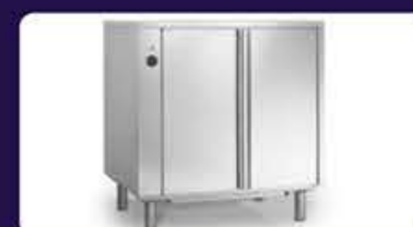
Θερμοθάλαμος Διαστάσεων: 90 x 66 x 85 cm Χωρητικότητα: 8 λαμαρίνες (60 x 40 cm) Διάκενο: 73 mm Ισχύς: 2,6 Kw Τάση: 230 V