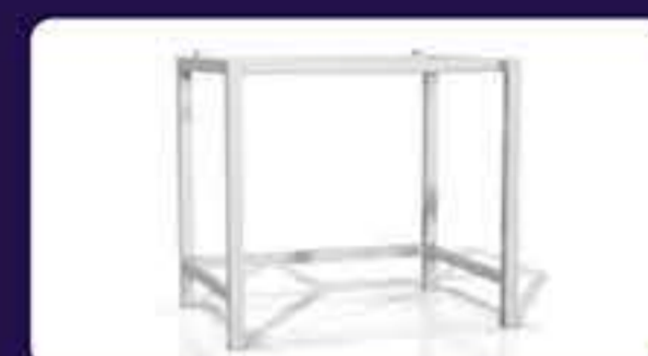
Ανοξείδωτη βάση Διαστάσεων: 90 x 66 x 85 cm