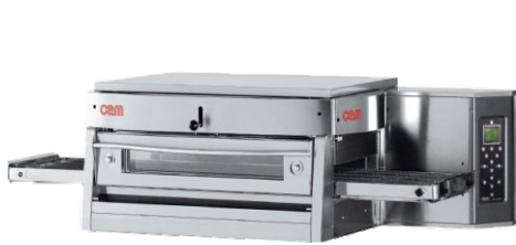
HV 50 E

Φούρνος κατάλληλος για ψήσιμο πίτσας και γαστρονομικών σπεσιαλιτέ με χαμηλή κατανάλωση ενέργειας. Χαμηλή απώλεια θερμότητας στο περιβάλλον. Διαθέτει ειδικό σύστημα μόνωσης για αποφυγή της θερμότητας στα εξωτερικά μέρη, φαρδιά πόρτα με διπλό κεραμικό γυαλί, 2 ταχύτητες ανεμιστήρα και 30 προγράμματα ψησίματος πίτσας και 30 ειδικά προγράμματα ψησίματος γαστρονομικών σπεσιαλιτέ. Μπορεί να γίνει παύση του ιμάντα μεταφοράς για μεγαλύτερη διάρκεια ψησίματος του προϊόντος