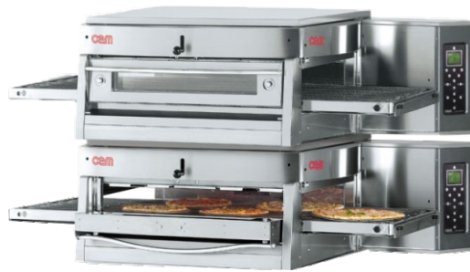
HV 75 E