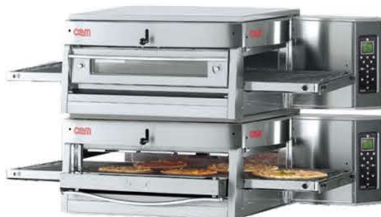
HV 75 E