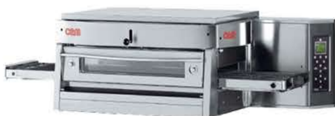
HV 50 E

Φούρνος κατάλληλος για ψήσιμο πίτσας και γαστρονομικών σπεσιαλιτέ με χαμηλή κατανάλωση ενέργειας. Χαμηλή απώλεια θερμότητας στο περιβάλλον. Διαθέτει ειδικό σύστημα μόνωσης για αποφυγή της θερμότητας στα εξωτερικά μέρη, φαρδιά πόρτα με διπλό κεραμικό γυαλί, 2 ταχύτητες ανεμιστήρα και 30 προγράμματα ψησίματος πίτσας και 30 ειδικά προγράμματα ψησίματος γαστρονομικών σπεσιαλιτέ. Μπορεί να γίνει παύση του ιμάντα μεταφοράς για μεγαλύτερη διάρκεια ψησίματος του προϊόντος