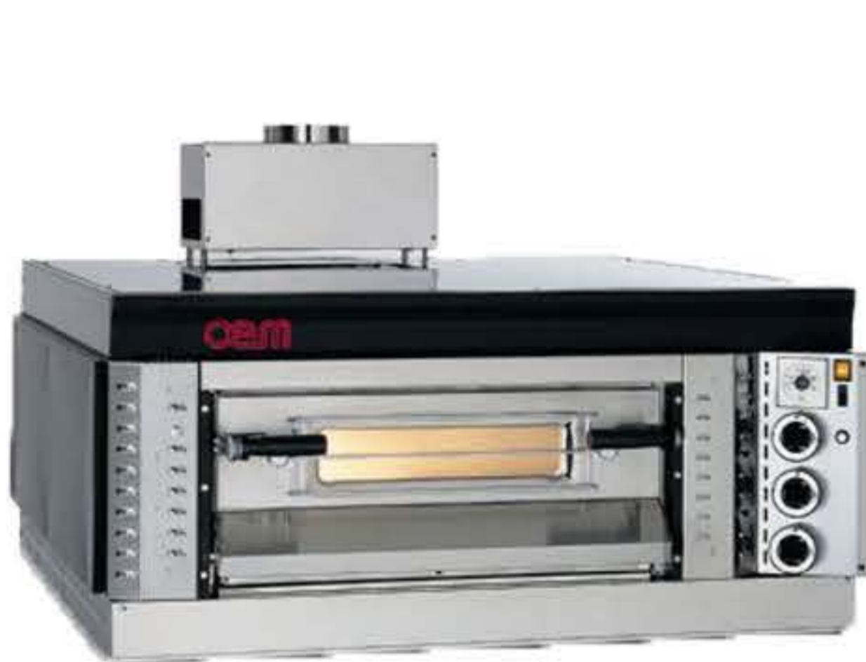
SG69 / 1