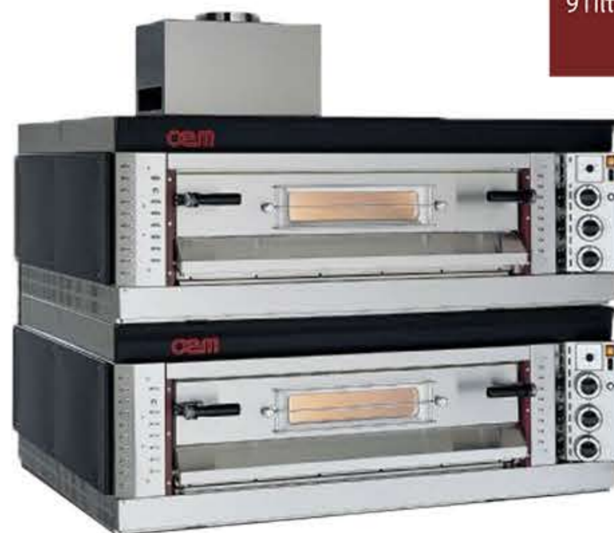
SG99 / 2