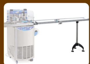
Ιμάντας εξόδου 2 μέτρα - 180/250/320 mm