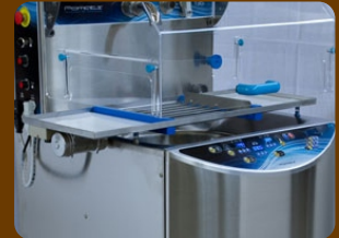
Κάλυπτρο από πλέξιγκλας