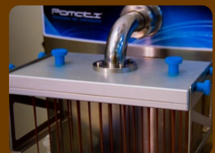
Δοσομετρική πλάκα για φόρμες σοκολάτας