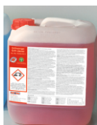
Υγρό καθαρισμού για Combi Master Δοχείο 10 λίτρων