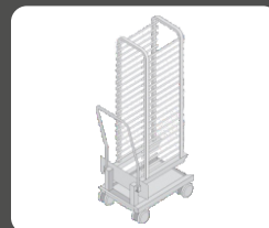
Καρότσια ραφιών κανονικό 20 θέσεων