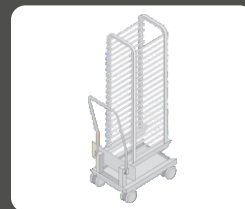
Καρότσια ραφιών κανονικό 20 θέσεων