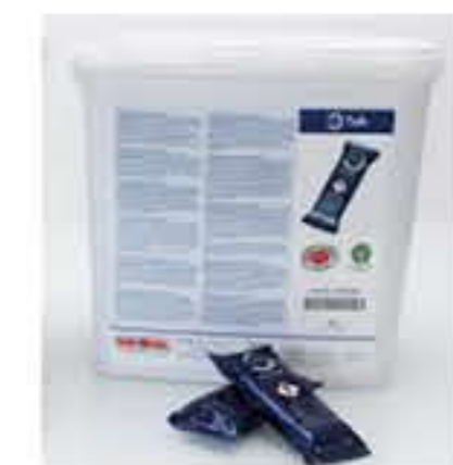
Δισκία περιποίησης της RATIONAL για όλα τα SelfCookingCenter με CareControl δισκία φροντίδας (Care - Tabs), 100 τεμ.