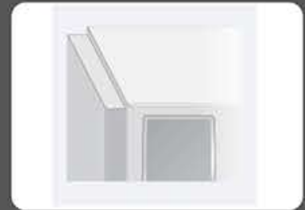
Ασπίδα προστασίας θερμότητας για το αριστερό τοίχωμα