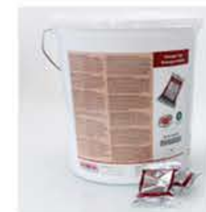
Δισκία καθαρισμού της RATIONAL για όλα τα SelfCookingCenter δισκία καθαρισμού, 100 τεμ.