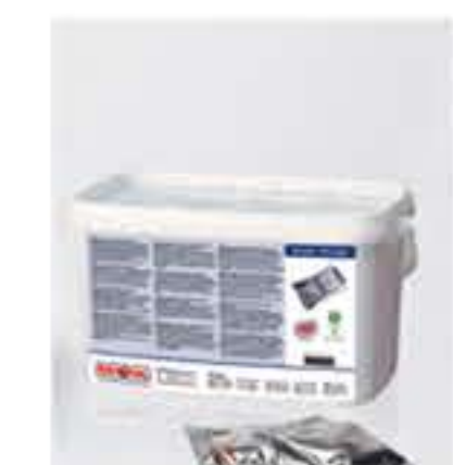
Δισκία ξεπλύματος RATIONAL για SelfCookingCenter χωρίς CareControl δισκία ξεπλύματος, 50 τεμ.