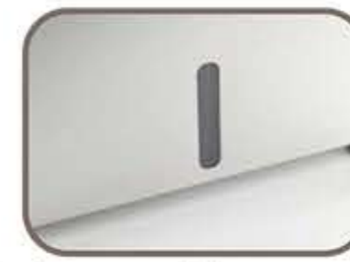
Δείκτης στάθμης νερού κάδου - boiler