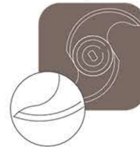
Λείο μαχαίρι κοπής