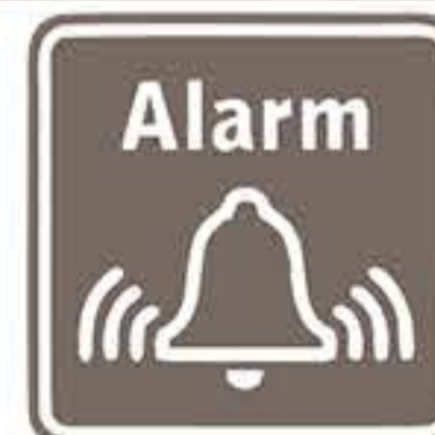
Ηχητική ειδοποίηση: -Τέλος κύκλου εργασίας -Χαμηλής στάθμης νερού κάδου - boiler