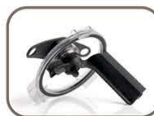
Διάφανο καπάκι με ξύστρα για τα πλαϊνά τοιχώματα του κάδου και για το καπάκι