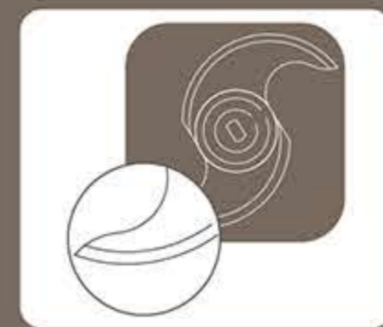
Λείο μαχαίρι κοπής