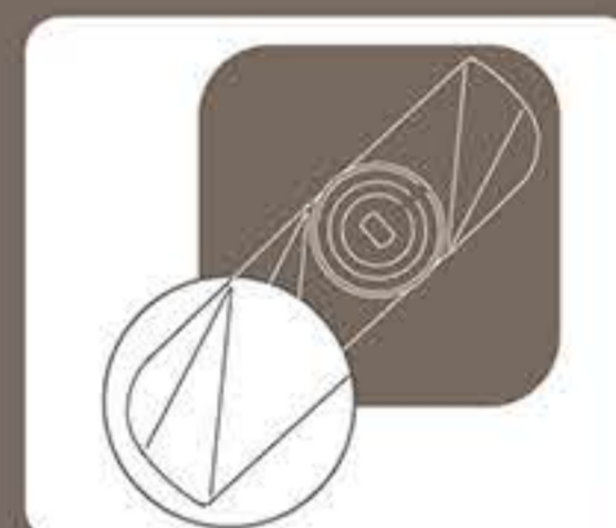
Εξάρτημα για ζύμες