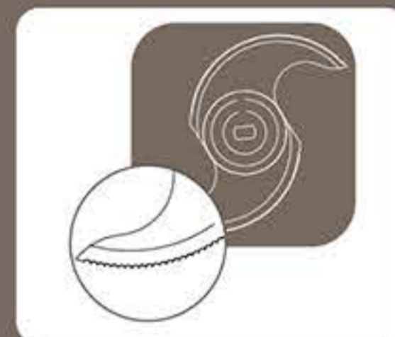
Οδοντωτό μαχαίρι κοπής