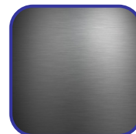
Εξ' ολοκλήρου ανοξείδωτη κατασκευή