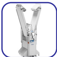
Μηχανή σε κλειστή θέση