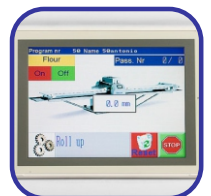
Οθόνη αφής έγχρωμη