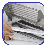
Ξύστρες για εύκολο καθαρίσμα της μηχανής