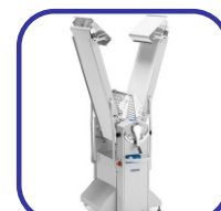
Μηχανή σε κλειστή θέση