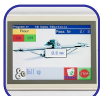
Οθόνη αφής έγχρωμη