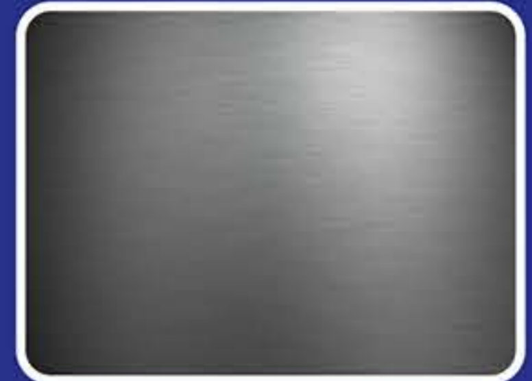
Εξ' ολοκλήρου ανοξείδωτη κατασκευή