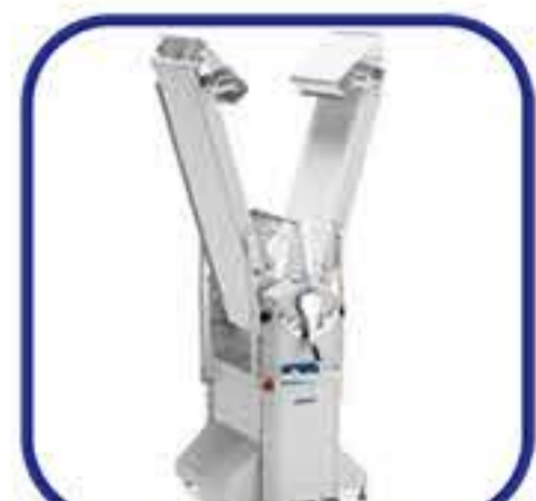
Μηχανή σε κλειστή θέση