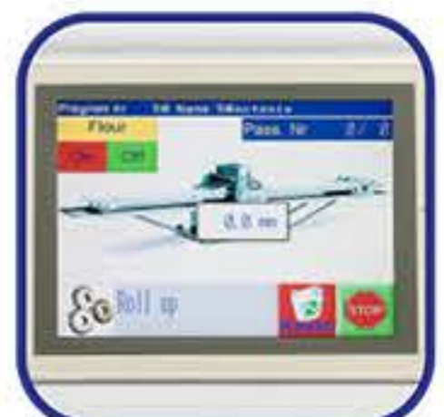
Οθόνη αφής έγχρωμη