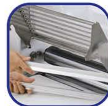
Ξύστρες για εύκολο καθαρίσμα της μηχανής