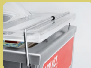
Σφιγκτήρας για το καπάκι