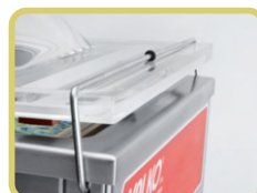
Σφιγκτήρας για το καπάκι

( FAVOLA 25. - FAVOLA 315/) (FAVOLA 415/ - FAVOLA 500/)